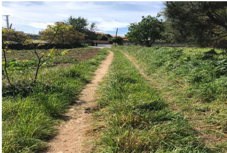
Foto da zona da Lomba, rúa Pedriñas, donde entronca o camiño 9011.

3.- O camiño facilitaría a comunicación entre a zona norte de Palmeira ea zona oeste, Grupo escolar.