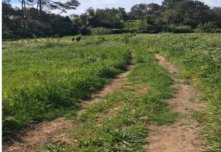
Foto do recorrido do Camiño veciñal.

2.- O camiño preséntase transitado por tractores e moxóns as beiras do Camiño vecinal 9011 do polígono 35.