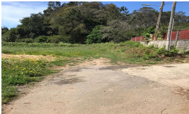
Foto do inicio do Camiño veciñal visto dende o Brañal.

1.- A vía pública a considerar Camiño do Brañal (camino de carro), ten unha lonxitude duns 275 metros, dende o tramo asfaltado no Camiño de Pedriñas ata o tramo pavimentado na zona do Brañal, achego fotos do trazado.