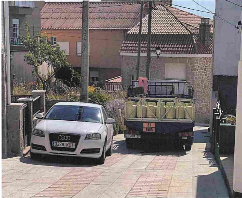
Outra foto da rúa do Mar, con vehículos estacionados que dificultan o reparto.

Enterados/as os/as Sres/as concelleiros/as do contido da proposición do GM do Ps de G-Psoe , rematadas as intervencións nos termos que obran no arquivo audiovisual que incorpórase á presente acta como parte integrante da mesma en cumprimento do disposto no DECRETO 24/2018, DE 15 DE FEBREIRO, DA VICEPRESIDENCIA E CONSELLERÍA DE PRESIDENCIA, ADMINISTRACIÓN PÚBLICAS E XUSTIZA, SOBRE OS LIBROS DE ACTAS E RESOLUCIÓN DAS ENTIDADES LOCAIS GALEGAS, sómese a votación ordinaria o ditame da Comisión Informativa de Urbanismo, Infraestructuras, Benestar Social e Medio Ambiente de data 19 de xullo de 2022 co seguinte resultado: