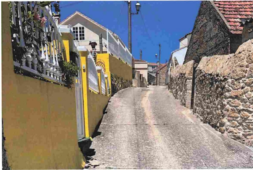
Rúa Porto Novo, foto do estreito vial coas vivendas e portais pegados a vía.